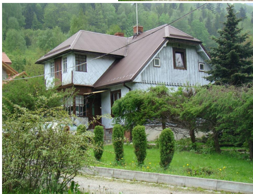
Widok domu od strony pn