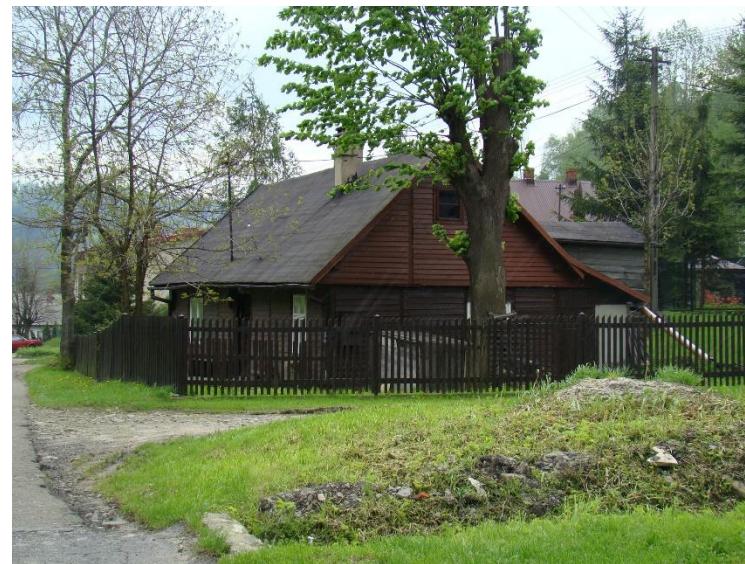
Widok domu od strony pd-zach