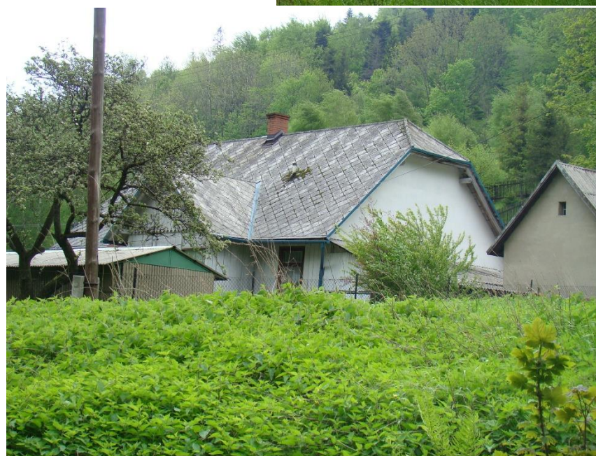
Widok domu od strony pn-zach