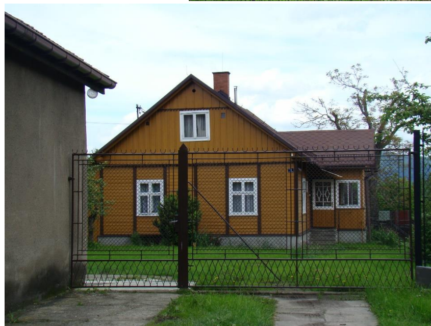
Widok domu od strony pd