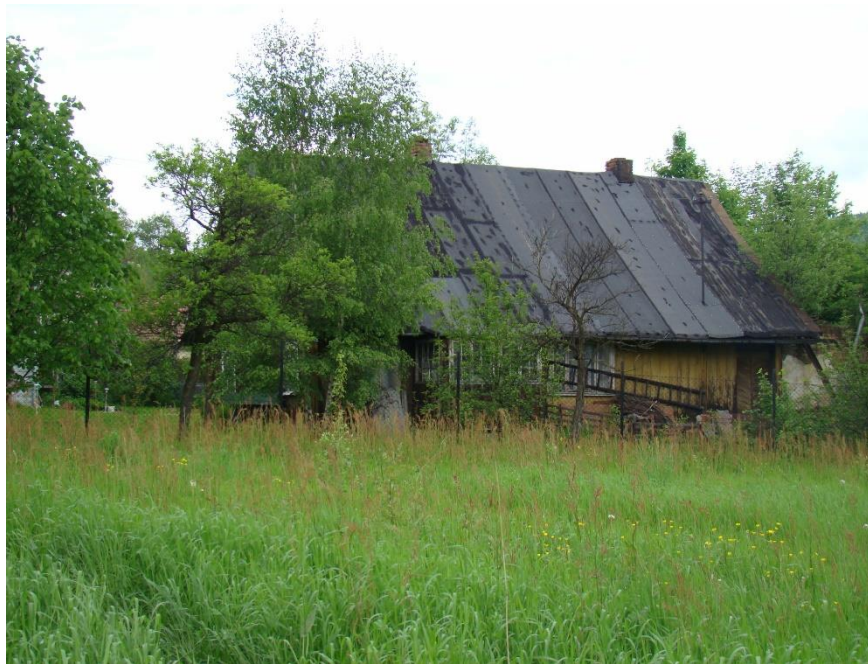
Widok domu od strony pd-wsch