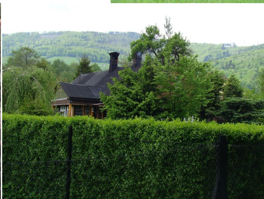
Widok domu od strony pd-zach