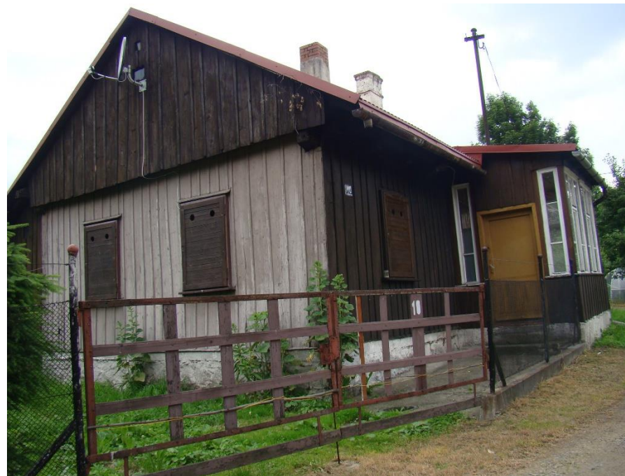
Widok budynku od strony pn