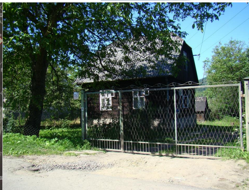
Widok budynku od strony pd