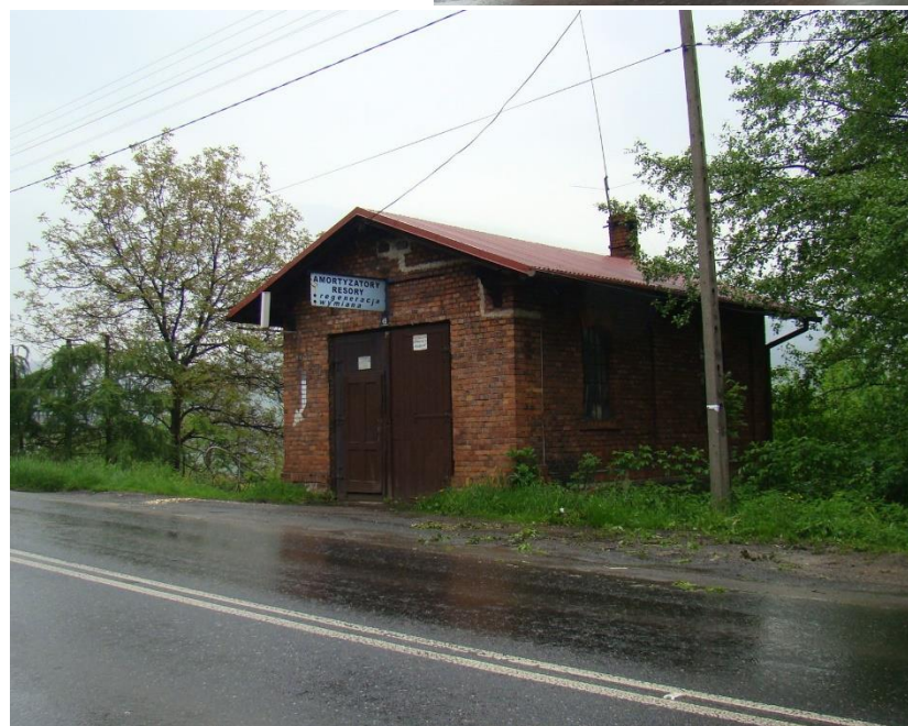
Widok budynku od strony pd