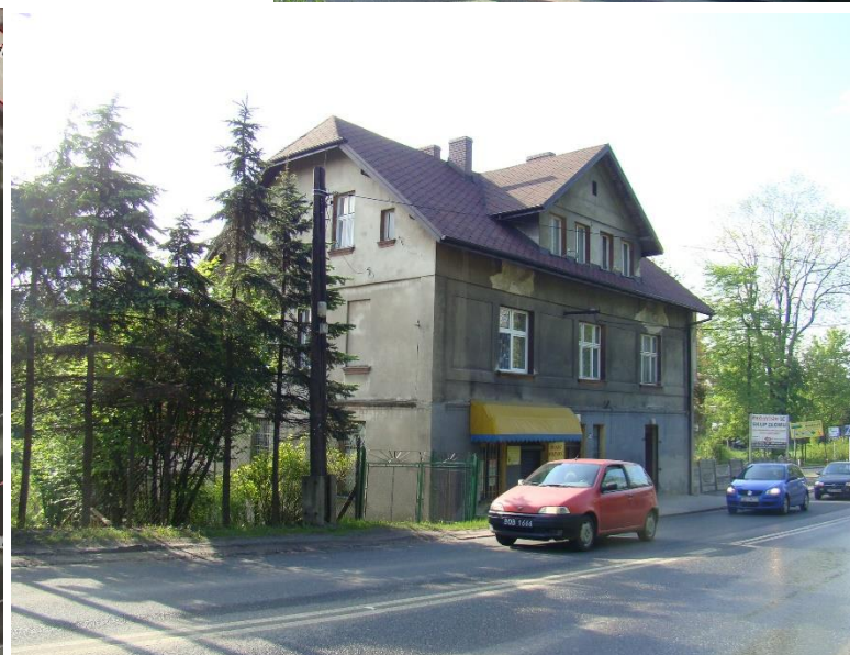
Widok budynku od strony pn