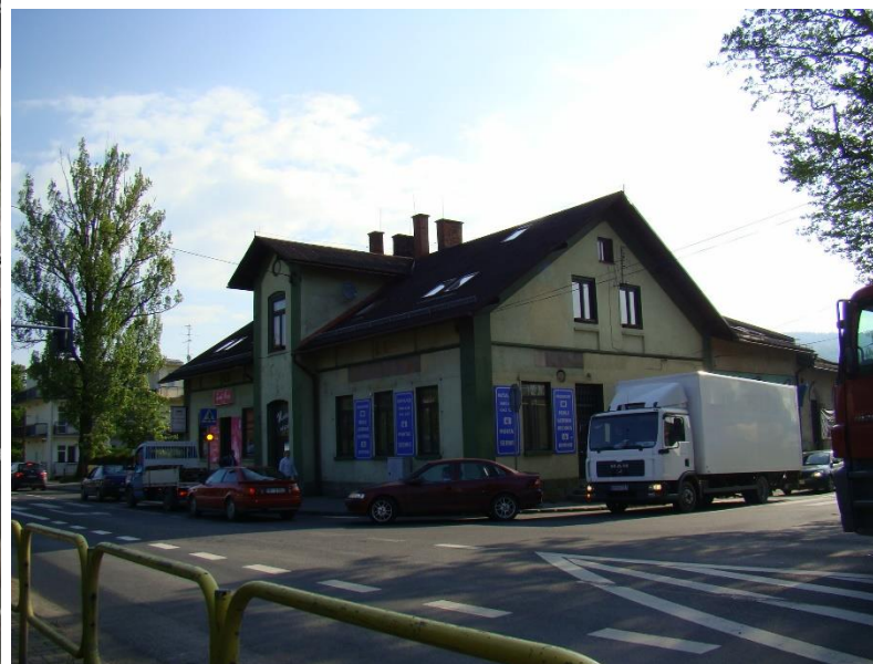
Widok budynku od strony pd