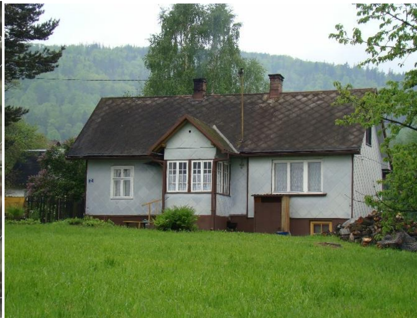
Widok budynku od strony wsch