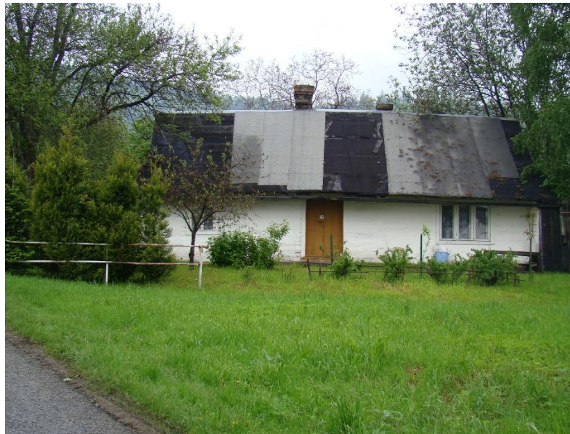
Widok budynku od strony wsch