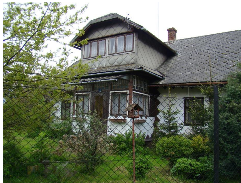
Widok budynku od strony pn-zach