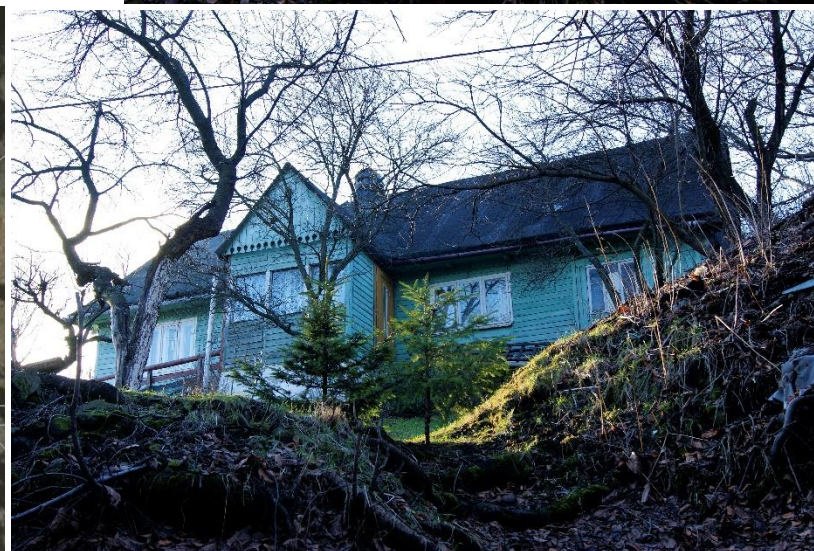
Widok domu od strony pn-wsch