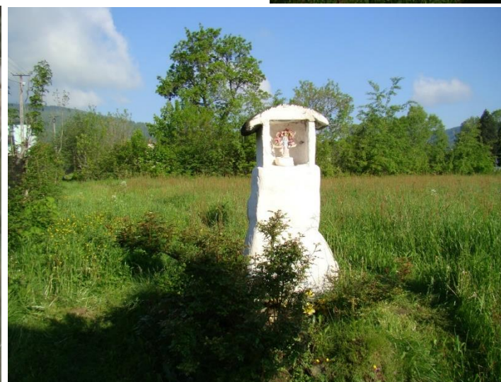
Widok kapliczki od strony wsch