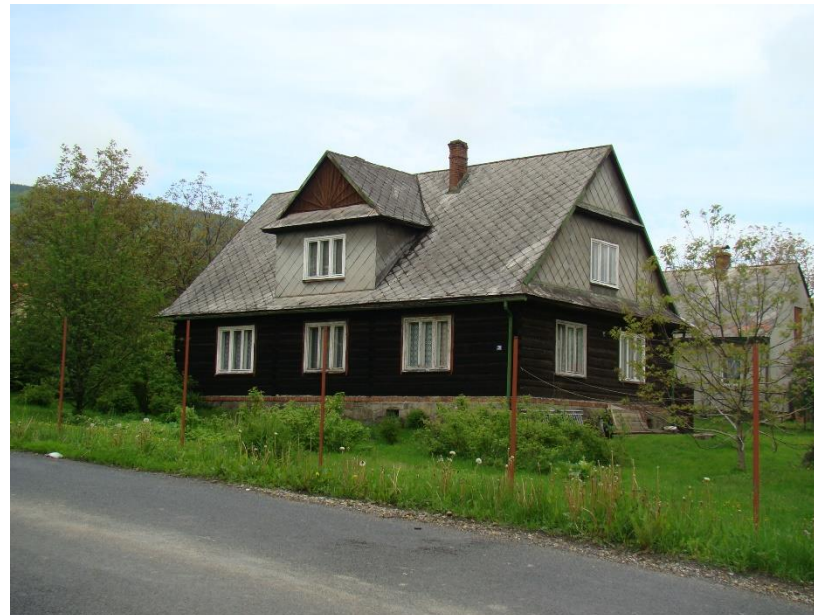
Widok budynku od strony wsch