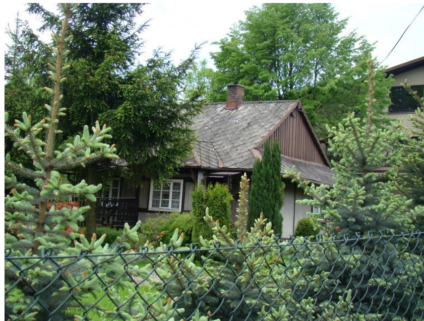
Widok budynku od strony pn-wsch