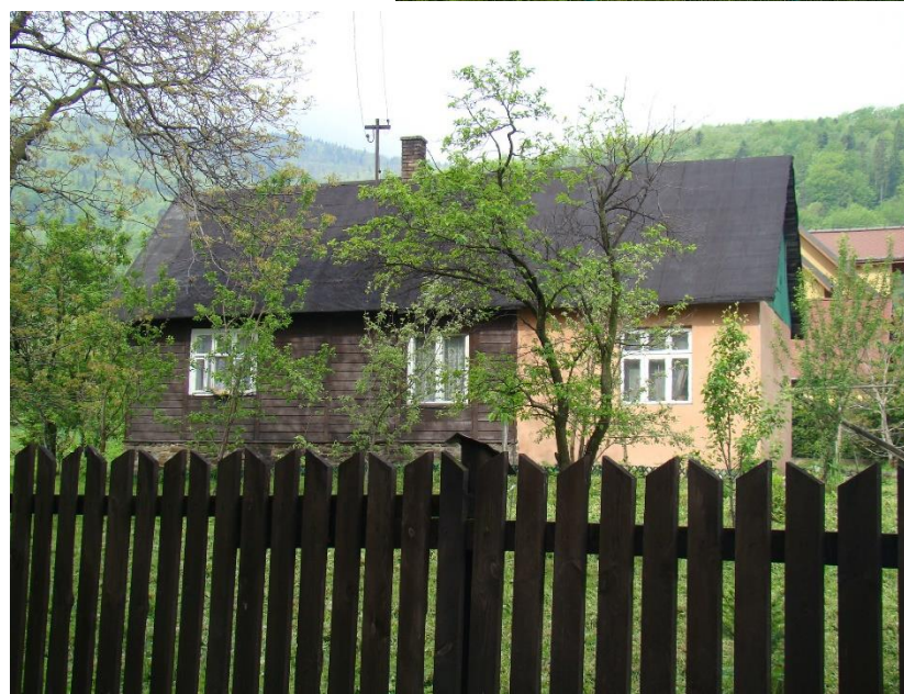
Widok budynku od strony wsch