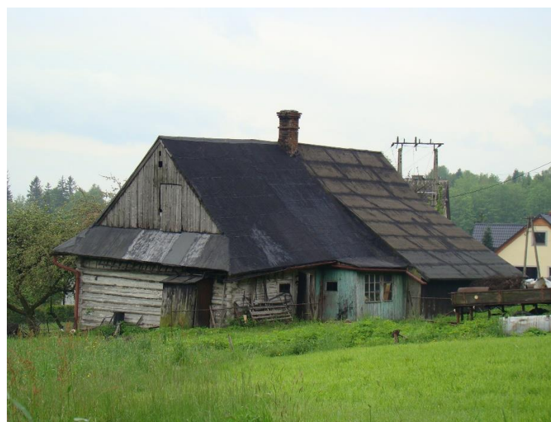
Widok budynku od strony pn-zach