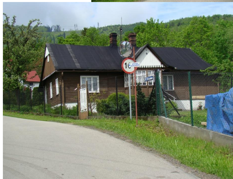
Widok budynku od strony wsch