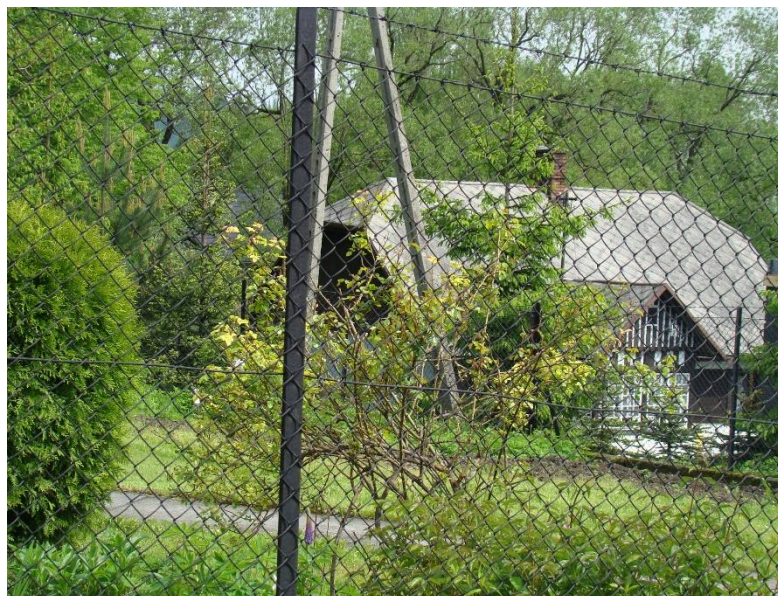
Widok budynku od strony pd