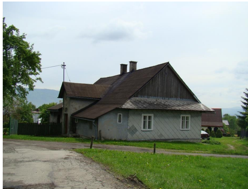
Widok budynku od strony zach