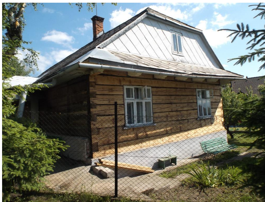
Widok domu od strony pn-zach