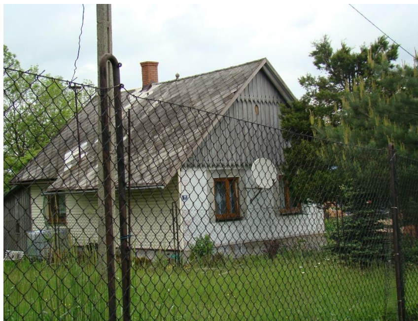
Widok domu od strony pd-zach