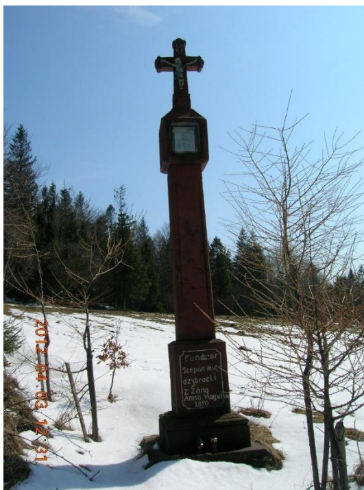
Widok kapliczki od strony pn-wsch