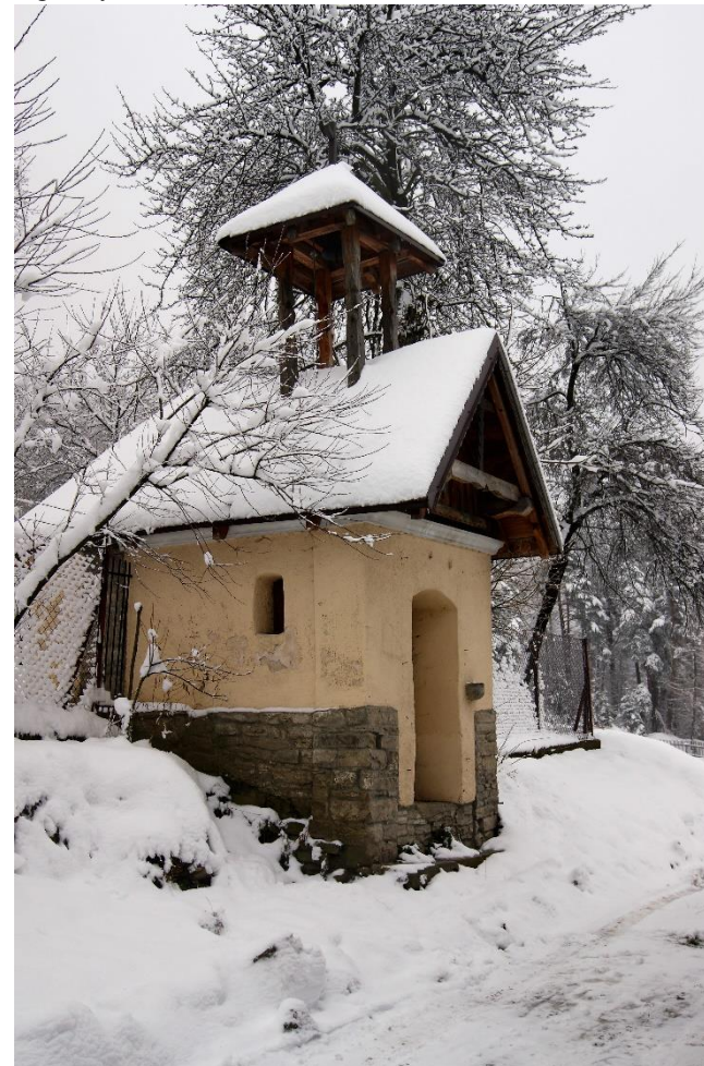
Widok kapliczki od strony zach