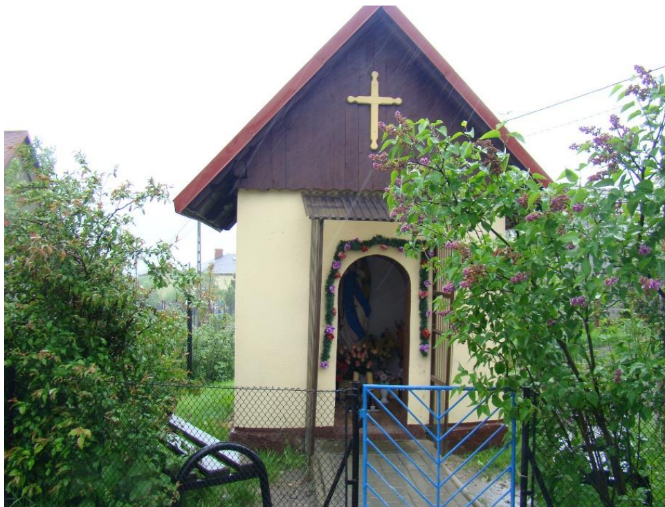
Widok frontowy kapliczki (od strony pn-wsch)