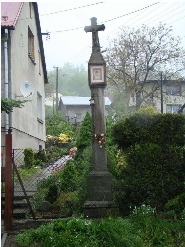
Widok frontowy krzyża

8. Fotografia z opisem wskazującym orientację albo mapa z zaznaczonym stanowiskiem archeologicznym