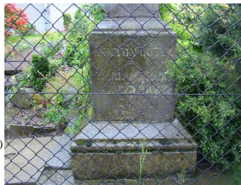
Ortofotomapa (geoportal.powiat.bielsko) z zazn. lokalizacją krzyża