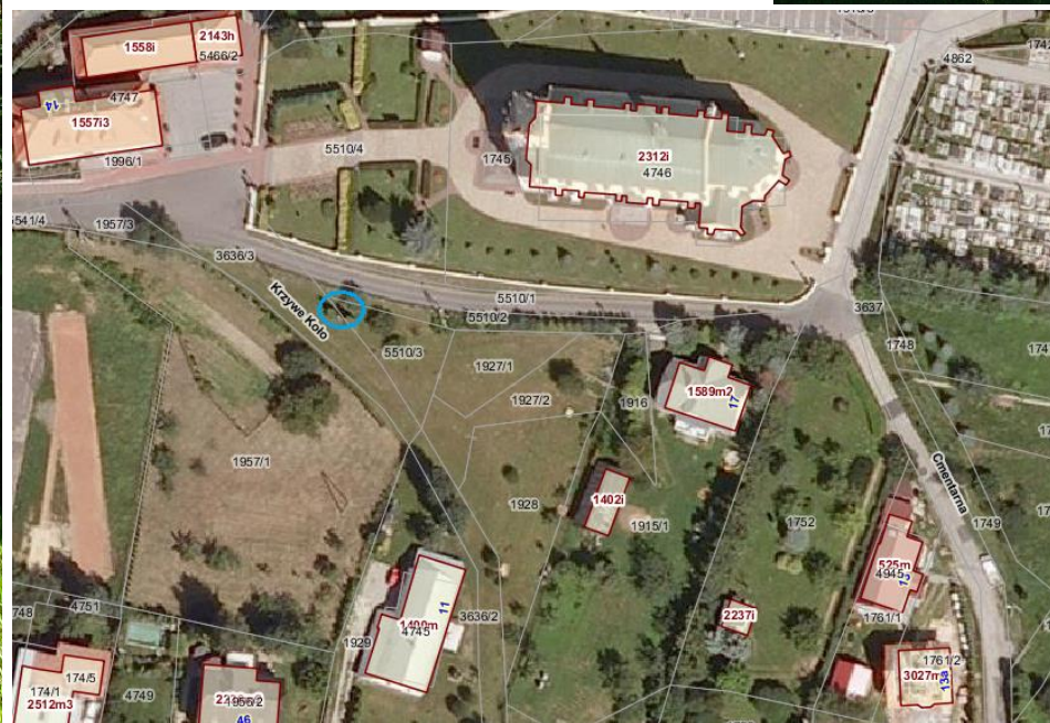
Ortofotomapa z zazn. lokalizacją figury