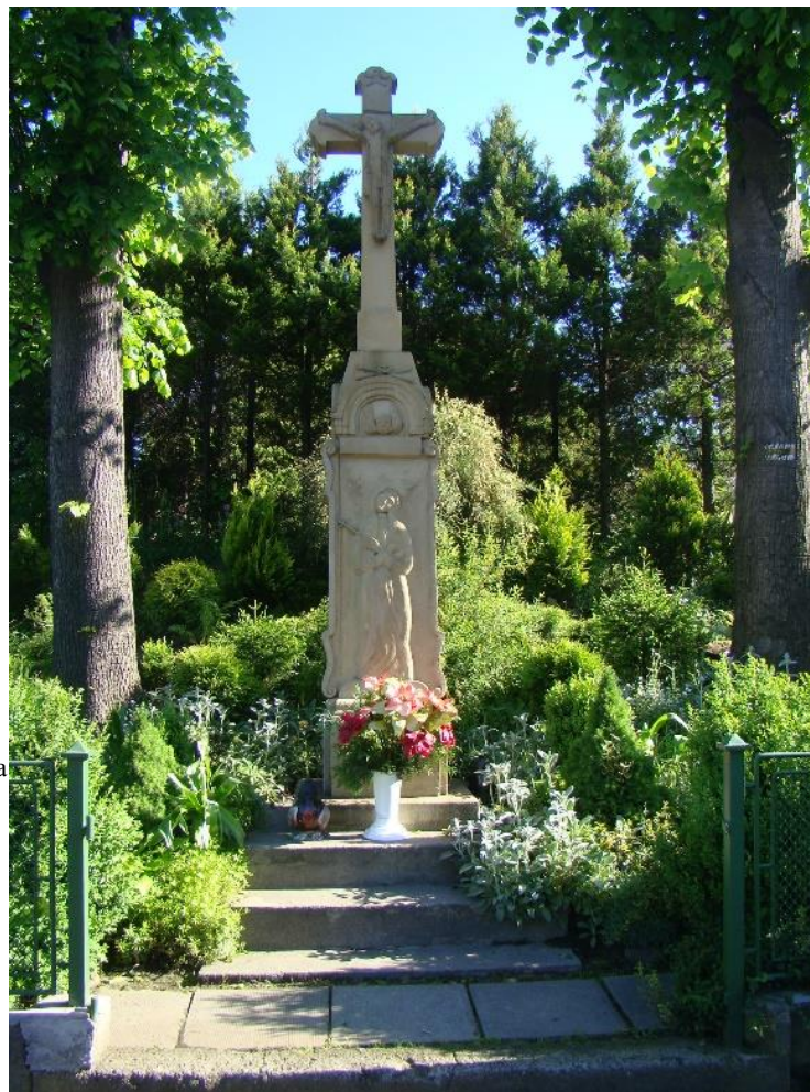
Widok frontowy krzyża (od strony pd)