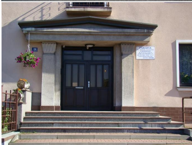
Widok plebanii od strony pd-wsch

(autor, data i podpis) Prac. Proj.-Konserwatorska ARKADA listopad 2017r.