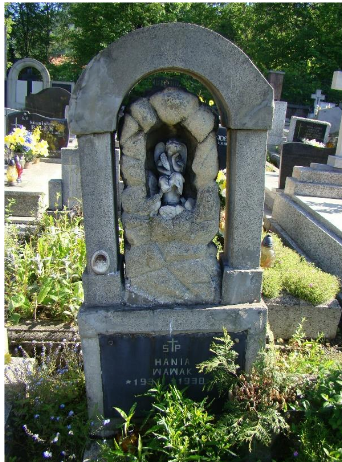
Zabytkowy pomnik nagrobny na cmentarzu

Ortofotomapa (geoportal.powiat.bielsko) z zazn. granicą cmentarza