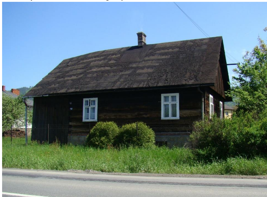
Widok domu od strony zach