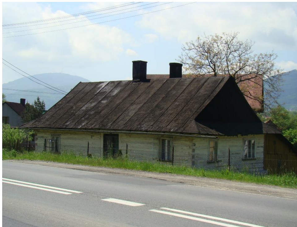
Widok chałupy od strony pn-wsch