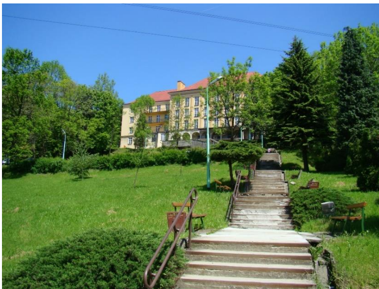
Ogród szpitalny, w głębi budynek szpitala, widok od strony pd-zach