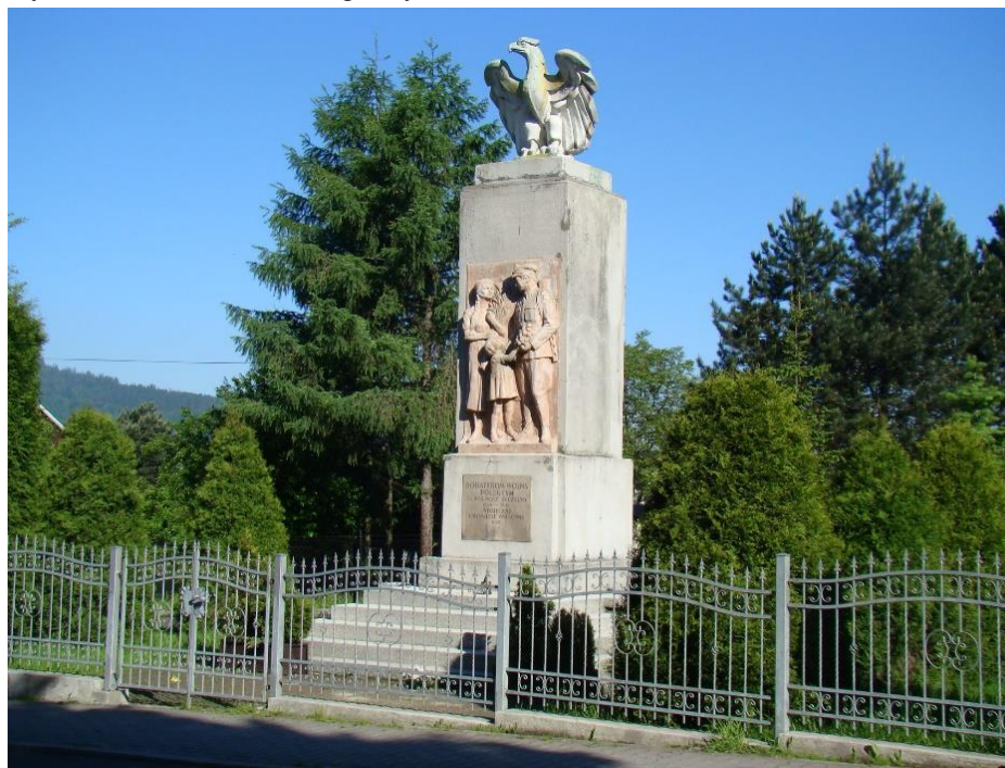
Widok pomnika od strony wsch