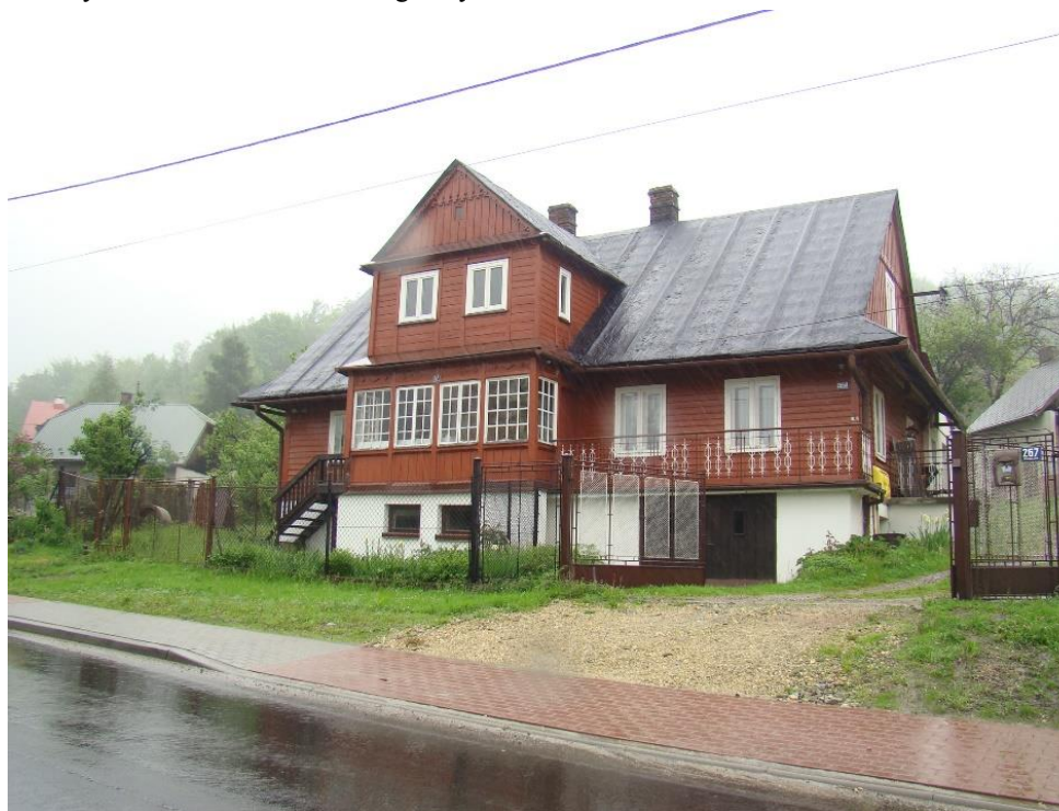
Widok domu od strony pd-zach