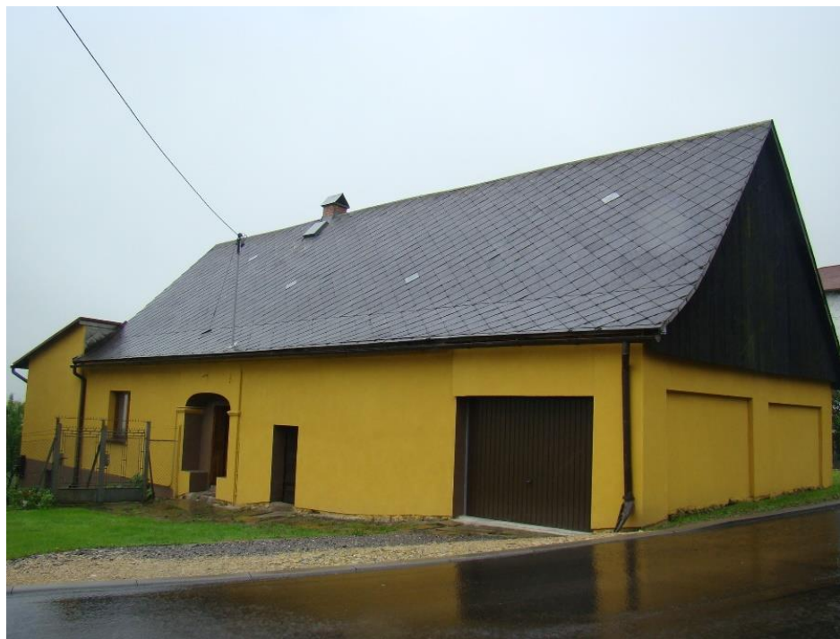
Widok domu od strony pd-wsch