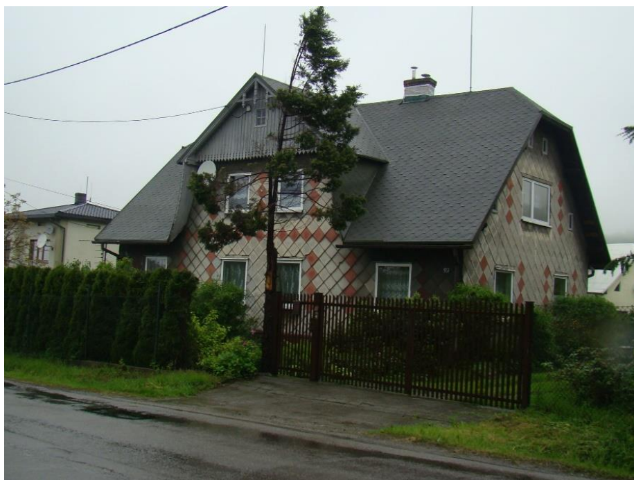
Widok domu od strony wsch