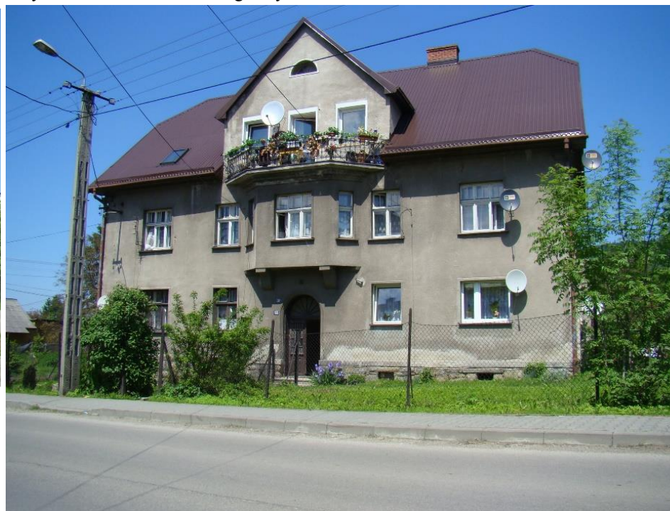
Widok domu od strony pd