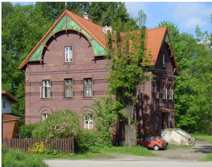
Widok domu od strony wsch

8. Fotografia z opisem wskazującym orientację albo mapa z zaznaczonym stanowiskiem archeologicznym