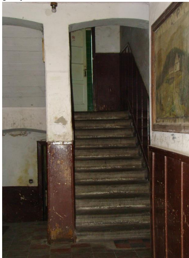
Wnętrze domu: widok na sień i klatkę schodową