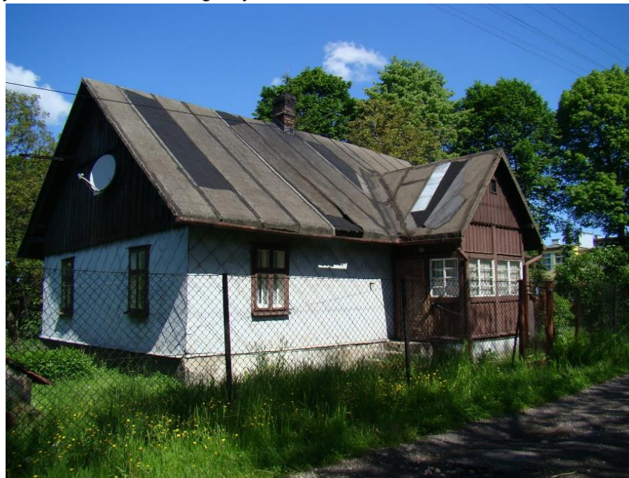
Widok od strony pd-wsch