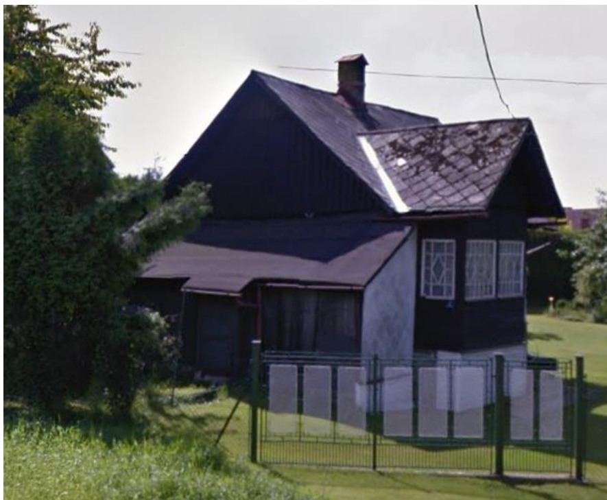
Widok domu od strony pn