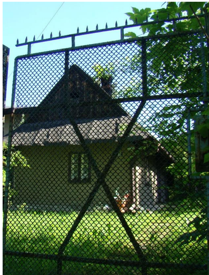
Widok chałupy od strony pd-wsch Ortofotomapa (geoportal.powiat.bielsko) z zazn. lokalizacją chałupy