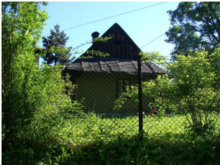
Widok chałupy od strony pd

8. Fotografia z opisem wskazującym orientację albo mapa z zaznaczonym stanowiskiem archeologicznym