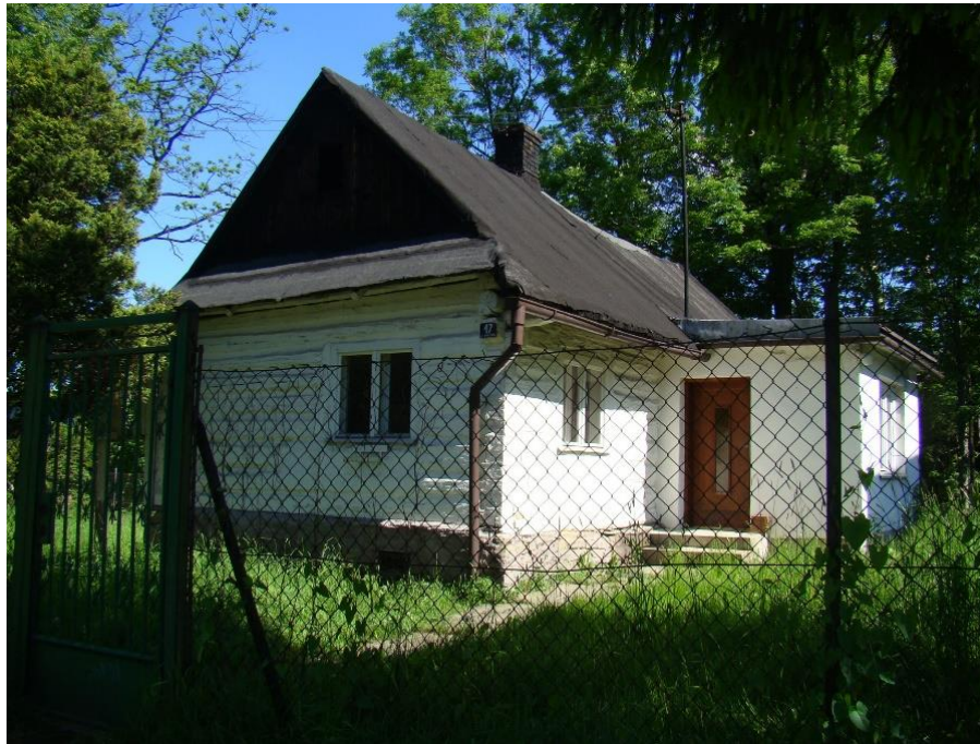
Widok chałupy od strony pd-wsch