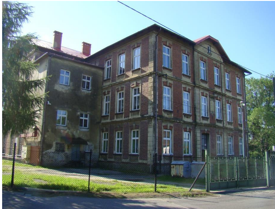
Widok budynku szkoły od strony pn