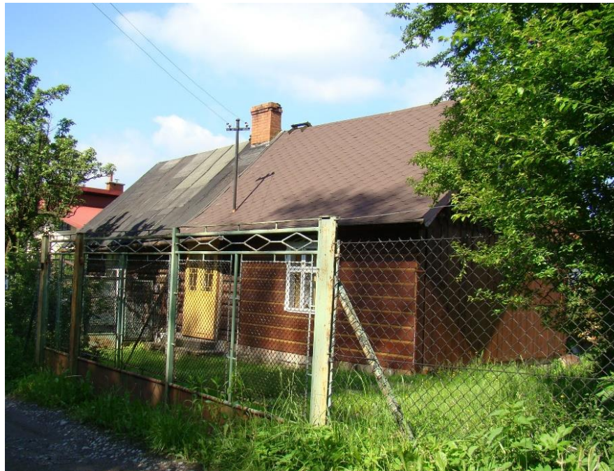
Widok domu od strony pn