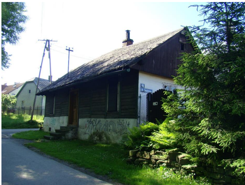
Widok od str.pn-wsch

8. Fotografia z opisem wskazującym orientację albo mapa z zaznaczonym stanowiskiem archeologicznym