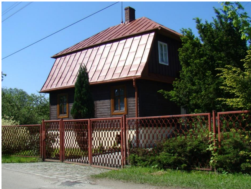
Widok domu od strony pd

8. Fotografia z opisem wskazującym orientację albo mapa z zaznaczonym stanowiskiem archeologicznym